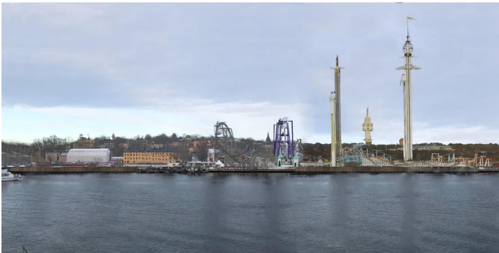
Gröna Lunds gamla område. Insane och Monster har flyttat fram positionerna.

Gröna Lund har på detta sätt flyttat fram positionerna, de senaste åren genom att ta två stora kliv norrut med byggena Insane och Monster. Nu vill man fortsätta på samma sätt ända bort till Spårvägshallen/Vasahamnen och tycker sig antagligen ha rätt till det när det gått så enkelt att flytta fram positionerna på det gamla området”.